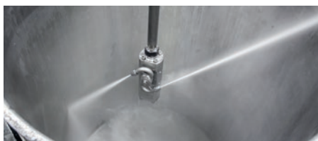
3-я передача – полная мощность насоса