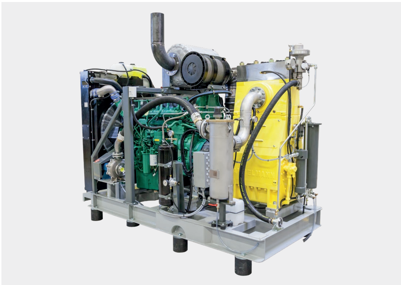
Стационарная установка с дизельным двигателем