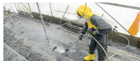
1-я передача – малая мощность насоса

Например, для очистки труб и теплообменников